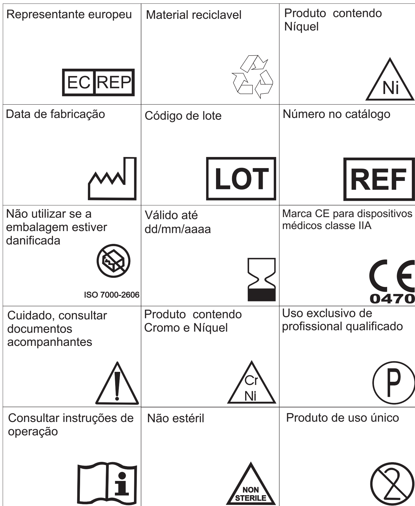
Tabela de Referência de símbolos utilizados nos rótulos da Aditek